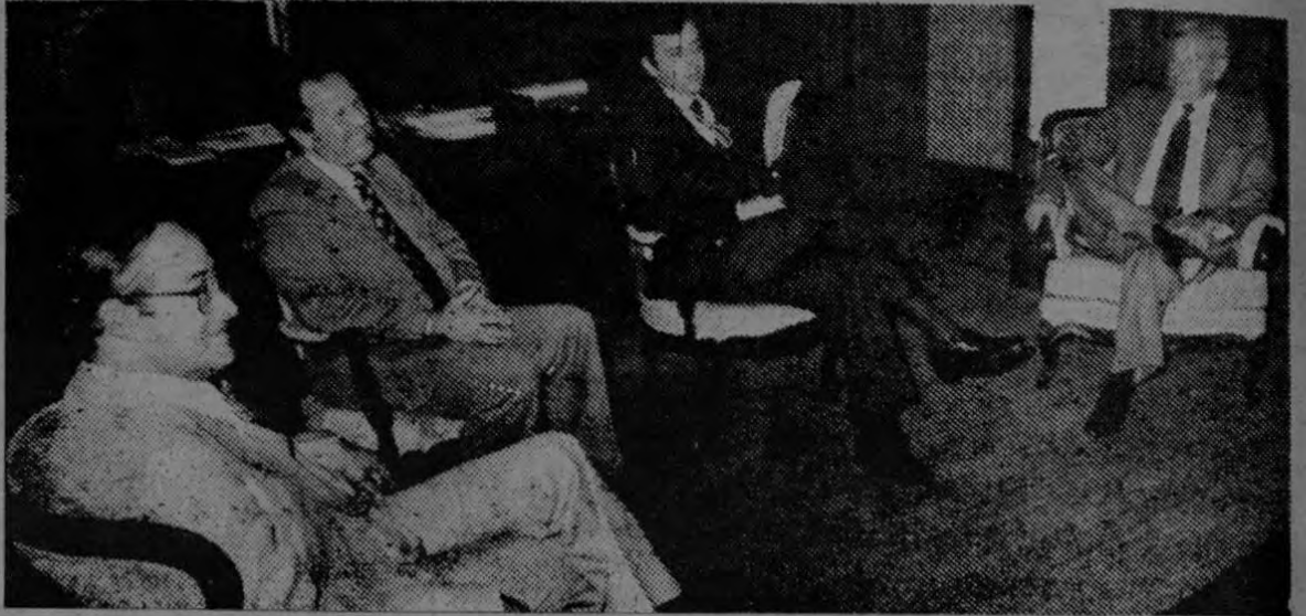
El presidente Carazo recibió el martes 7 de noviembre a los ministros de relaciones exteriores de El Salvador, José A. Rodríguez, derecha y de Guatemala, Rafael Castillo Valdés, izquierda,

No descartaron, empero, ese peligro para nuevas circunstancias.