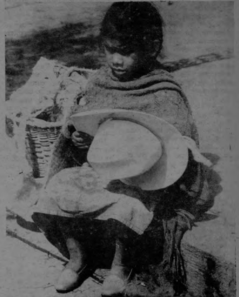
Estos son los que viven de este lado de la Cortina de la Tortilla.

ce 130 años. O lo que es peor y parece más factible para muchos: el surgimiento de una nueva nación.