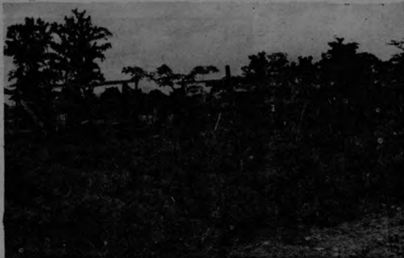
Parte de la construcción de ranchos que los afectados por la empresa Urbanística han empezado como medida drástica para que le den su dinero.