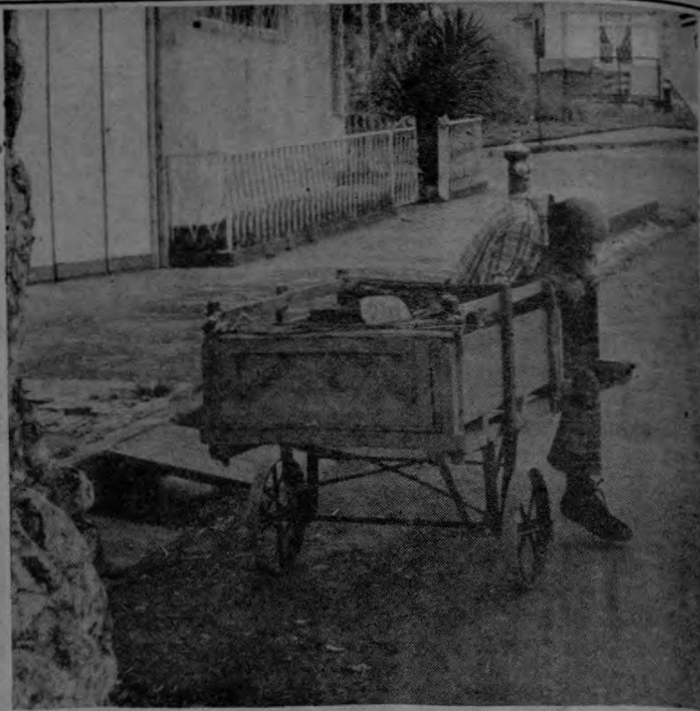
En la calle de San José, un trabajador que como tantos otros de nuestros país, cansado y desilusionado por el duro trabajo, se sienta y reflexiona sin querer decir ni su nombre.

te por esta iniquidad? ¿Qué dice a esto la Sociedad Amigos de los Animales? "Para dar ejemplo de virilidad, para hacer ver que uno es muy macho, hay que matar ballenas".