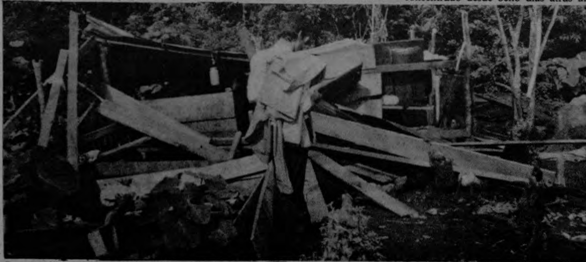
Las autoridades niegan que fuera la guardia la que destruyera casas y cultivos. Eso debe esclarecerse para que recaigan sobre los culpables, es decir, sobre la hacienda, las responsa-

La Fecc tramita el problema de las familias que invadieron las faldas del volcán Tenorio, en calidad de "conflicto de ocupación precaria" desde hace un año, sin que aún se encuentre agotada la vía administrativa para establecer legalmente los hechos, lo que de acuerdo con la Ley del Itco suspende todas las causas existentes en los juzgados contra los ocupantes, hasta tanto no se dé una resolución que desestime u otorgue validez al conflicto. Por tanto, la Fecc sostiene que había imposibilidad legal de establecer una nueva causa contra los precaristas, como se hizo.