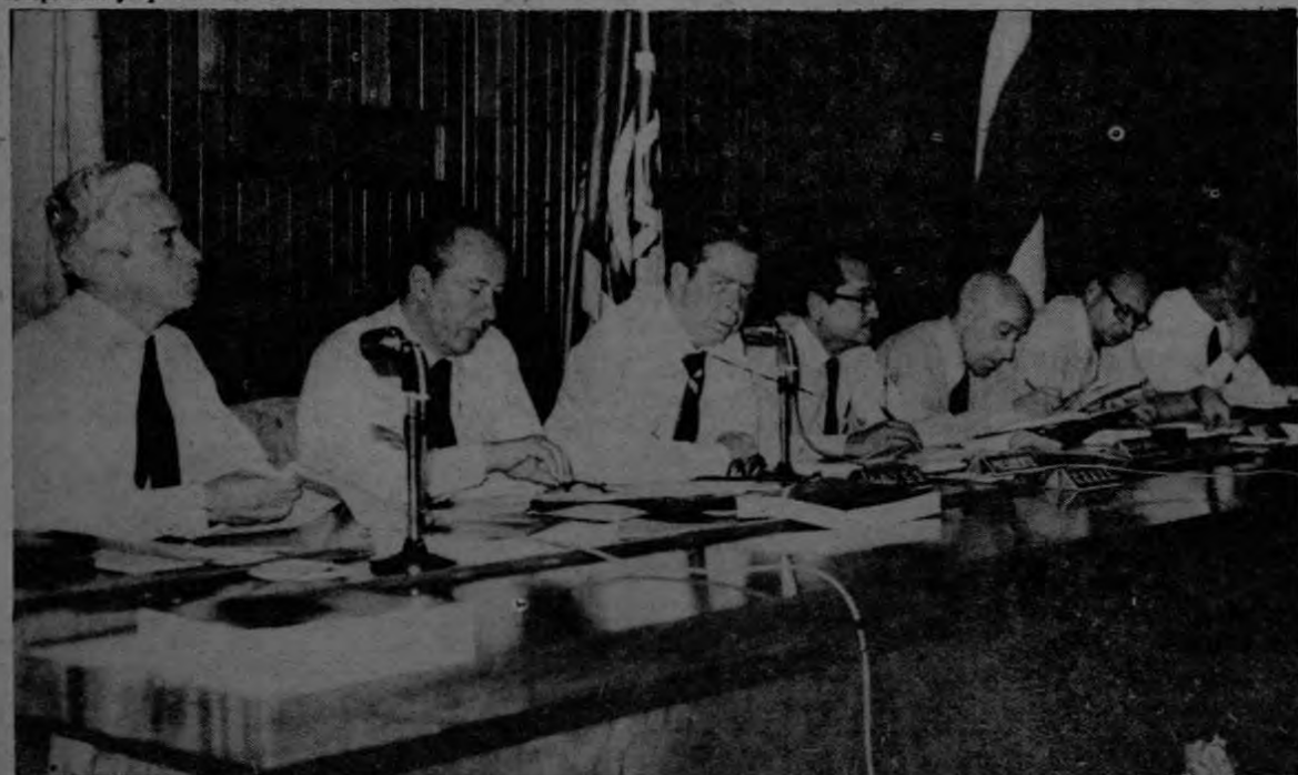
"La publicidad de los grandes consorcios que venden productos farmacéuticos condiciona psicológicamente a los asegurados, lo mismo que las etiquetas lujosas que llevan a pensar en una mejor calidad", estimó el VI